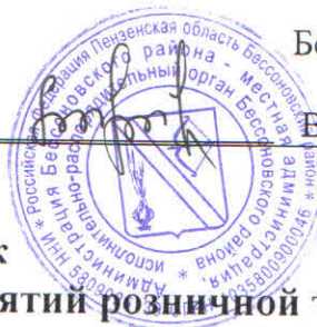
График проведения мониторинга предприятий розничной торговли и общественного питания, занимающихся реализацией алкогольной продукции, в рамках проведения месячника борьбы с контрафактной алкогольной продукцией с 5 декабря 2016 года по 5 января 2017 года